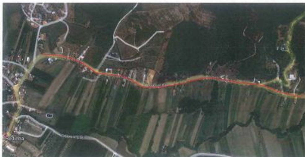
Figura 1 – Planta de localização das zonas a intervir

O presente documento é uma adenda ao Plano de Sinalização Temporário já aprovado , a implementar durante a execução da intervenção na Rua Principal (ver figura 1), na freguesia de Redinha, concelho de Pombal, no âmbito da empreitada “Construção do Emissário da Redinha, e Redes de Saneamento de Galiana, Barreiras e Lugares Limítrofes (Construção da Rede de Saneamento Doméstico na Zona Centro e Norte da Freguesia da Redinha) / Construção, Beneficiação e Reparação de Redes de Água (Remodelação de Rede de Abastecimento de Água no Mesmo Traçado”.